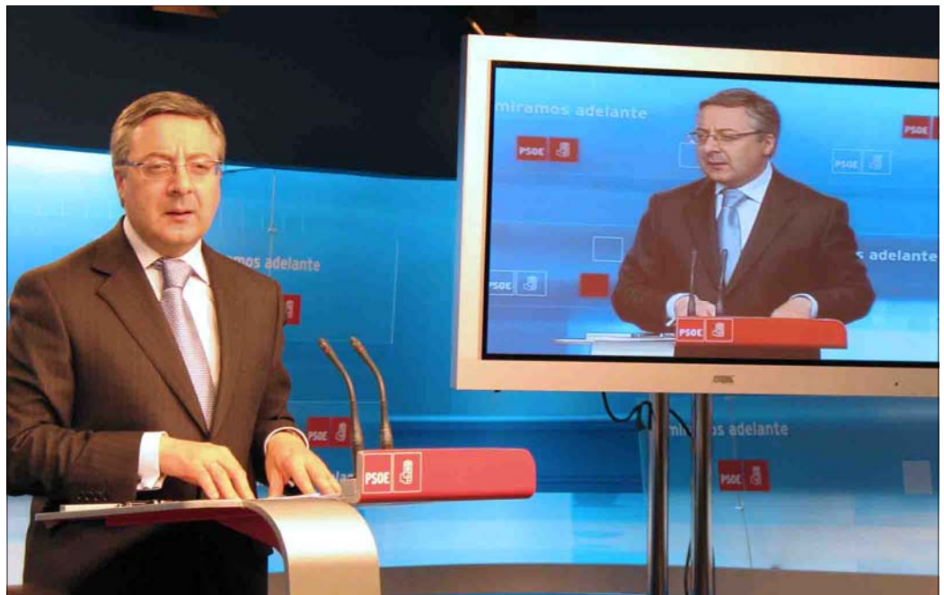
José Blanco, en la rueda de prensa que ofreció este lunes en Ferraz tras la reunión de la Ejecutiva del PSOE

Defendió la actuación del Gobierno que está cumpliendo con su deber de “aplicar la Ley y defender el Estado”, así como la del PSOE, que seguirá haciendo lo que ha hecho siempre desde el inicio de la democracia, que es apoyar al Gobierno, “a todos los gobier-