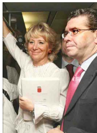
Aguirre incumple derechos básicos

El aspirante del PSOE a la Presidencia de la Comunidad de Madrid, Rafael Simancas, presentó este lunes el eslogan Defiende tus derechos como “lema de campaña y de gobierno” de su candidatura, que presentó con un acto en la Puerta del Sol en el que apeló a la participación” en las urnas el próximo 27 de mayo para lograr el “cambio” en la región. Acompañado de los componentes de su candidatura, prometió llevar a cabo “una campaña para conquistar el futuro y dejar atrás el pasado, para apostar por el cambio, para que tu voto valga”. Durante una breve intervención que fue aplaudida por todos los integrantes de su lista, Simancas destacó que, durante los doce años de gobierno del PP en la Comunidad de Madrid, los “derechos básicos” de los madrileños se han visto “rebajados a simples mercancías que se venden y se compran”.